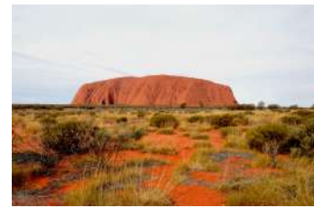
OUT BACK - AUSTRALIE OCÉANIE