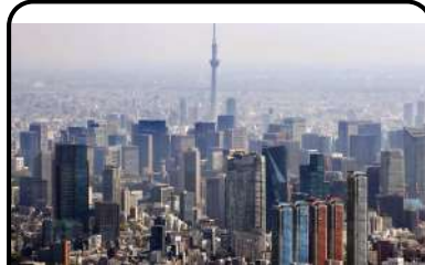
TOKYO - JAPON ASIE