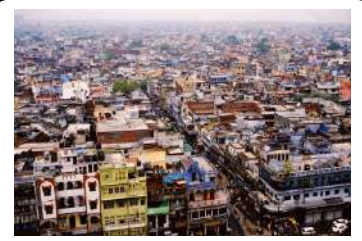
NEW DEHLI ASIE