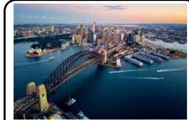
SYDNEY - AUSTRALIE OCÉANIE