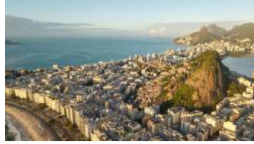
RIO DE JANEIRO - BRÉSIL AMÉRIQUE