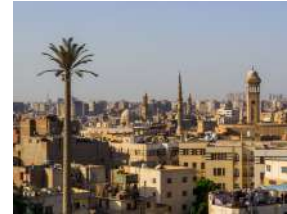
LE CAIRE - ÉGYPTE AFRIQUE