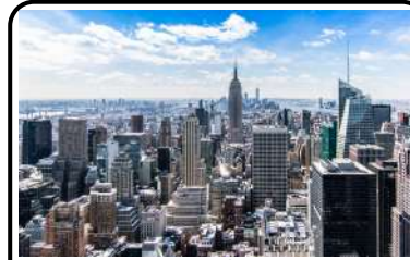
NEW YORK - ÉTATS UNIS AMÉRIQUE