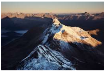
CHAÎNE DE L'HIMALAYA ASIE