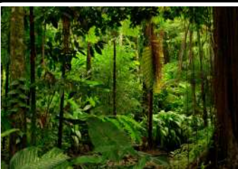
FORÊT AMAZONNIENNE AMÉRIQUE