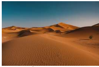
DÉSERT DU SAHARA AFRIQUE